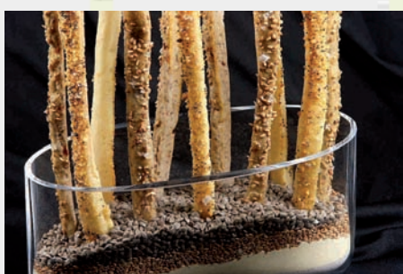
Bastonets de farro i fajol de la Garrotxa. Cuinera Carlota Giralt

Lloc: Sala d'exposicions de l'Ajuntament de la Vall de Bianya 1